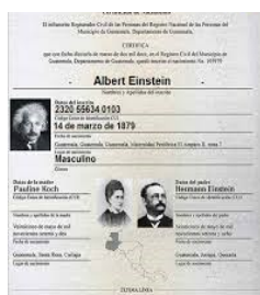
Un certificado por cada solicitante

El certificado de nacimiento es solicitado uno por cada solicitante, puede tramitarlo ante las oficinas de RENAP, o bien de manera virtual en la pagina de internet de RENAP.