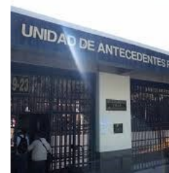
Unidad de Antecedentes penales del Organismo Judicial