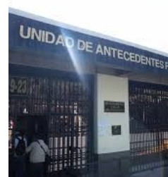
Unidad de Antecedentes penales del Organismo Judicial

LOS ANTECEDENTES PENALES TIENEN UN TIEMPO DE VIGENCIA DE 6 MESES.