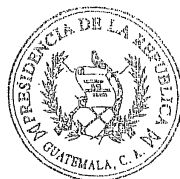
ALVARO COLOM CABALLEROS